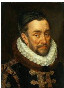
Willem van Oranje.

Er zijn ook duidelijke overeenkomsten met de onafhankelijkheidsverklaringen van de Verenigde Staten van Amerika in 1776 , zoals met name het principe dat de burgers het recht hebben om hun vorst te verlaten als die de wetten en traditionele vrijheden van de burgers niet respecteert.